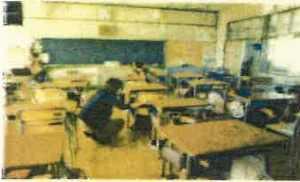
全学年シェイクアウトの訓練