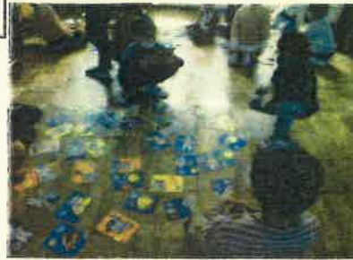
低学年防災カルタ