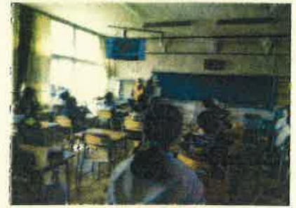
高学年危険箇所確認