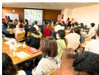
日本語教室の デモンストレーションの様子

プログラムは、参加外国人の国の歴史・文化・観光地などの紹介、美和高校茶道部による茶道体験、甚目寺観音の見学、あま市国際交流協会による日本語教室のデモンストレーションなど行いました、日頃触れることのない互いの国の特色を学びながら楽しく交流し、有意義な時間となりました。