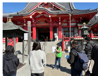
甚目寺観音ガイドtour