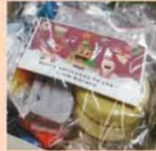
ベッドサイドで遊ぶおもちゃ

また、今回は子どもたちへのプレゼントと一緒に、付き添いの家族にも食支援とプレゼントを用意しました。入院中の子どもたちや家族は、和やかなクリスマスを過ごしました。