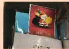
付き添い家族へのプレゼント

今年も「日本赤十字社愛知医療センター名古屋第一病院」と「名古屋医療センター」の小児病棟へ届けました。