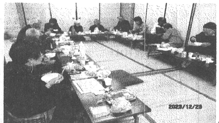
令和5年12月23日・カラオケ忘年会