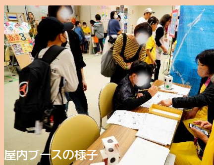
屋内ブースの様子