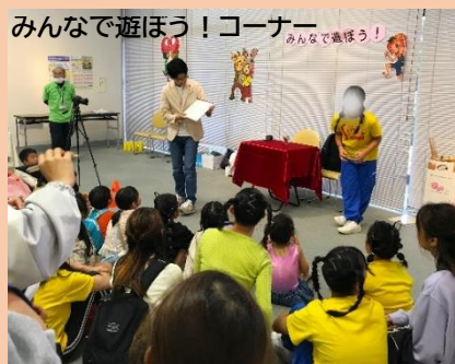
みんなで遊ぼう! コーナー みんなで遊ぼう!