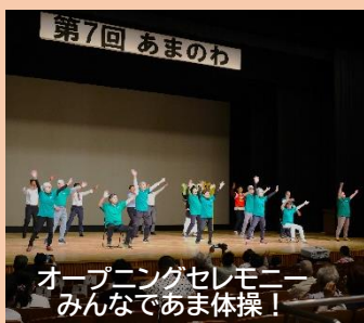
オープニングセレモニー みんなであま体操!