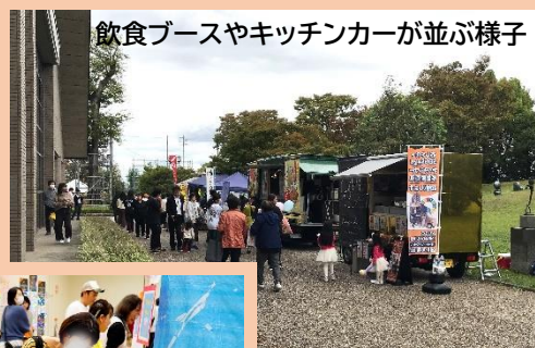
飲食ブースやキッチンカーが並ぶ様子