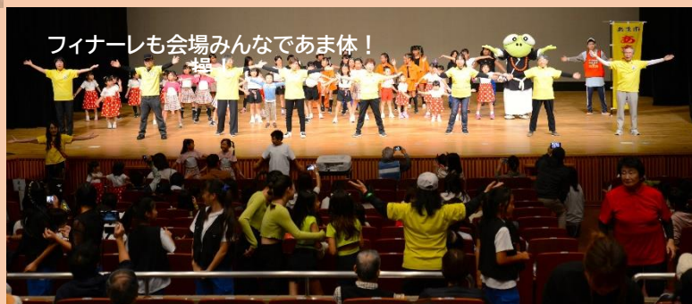
フィナーレも会場みんなであま体操!