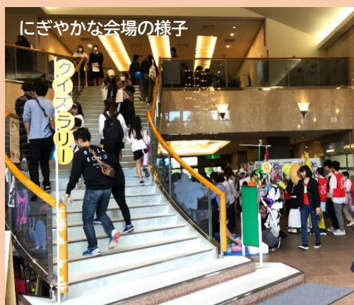
にぎやかな会場の様子