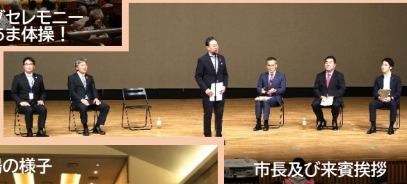
市長及び来賓挨拶